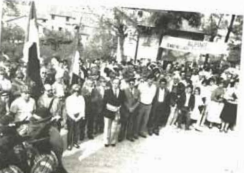
La corteo della festa del gruppo Alpini.