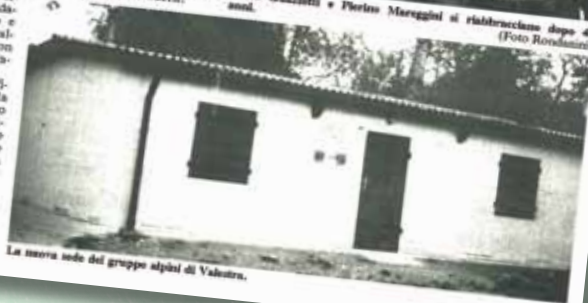
La nuova sede del gruppo alpini di Valestra.