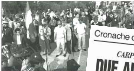
Un'immagine della precedente edizione del raduno delle